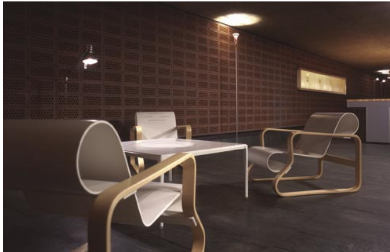
BPA - Andorra

El aspecto formal que aporta la estructura de policarbonato transparente enriquece sutilmente la desnudez de la bombilla y le da un aspecto de gran ligereza a toda la pieza. Con una pantalla orientable en un ámbito de 360°, y un fuste cilíndrico metálico, incorpora también un regulador de intensidad. Se presenta también en versión mini como lámpara de lectura. The formal aspect of the polycarbonate structure subtly enriches the nudity of the light and provides an extreme lightness to the whole structure. With an orientable lampshade of 360°, and a cylindrical metal shaft, it also includes a dimmer to regulate the intensity of light. A reading lamp version is also available.